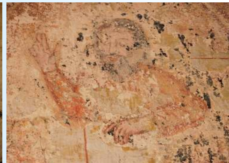
Des parties de murs étaient recouvertes par des décors figuratifs peints, ici un canard, là, un personnage religieux