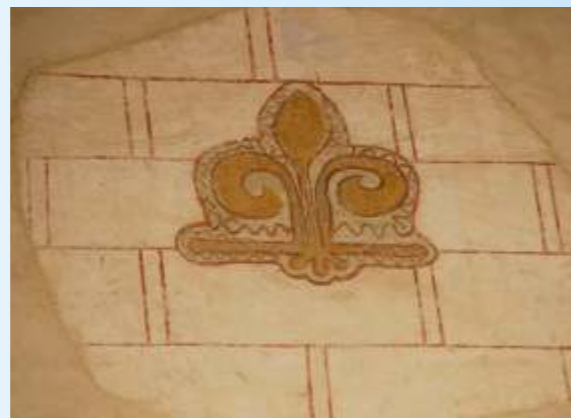
Le faux appareil (dessin de moellons avec double joint vertical)