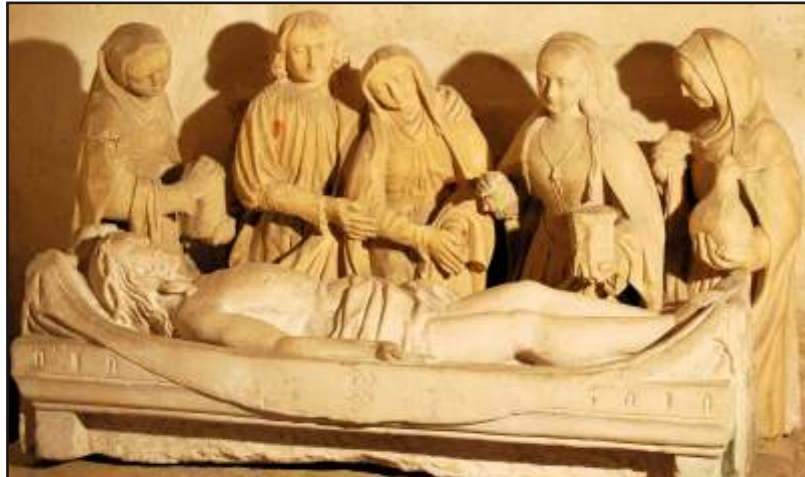
La "mise au tombeau" classée "Monument Historique", seuls le gisant du Christ et le tombeau en calcaire datent du dernier quart du 15e siècle, les autres personnages sont des moulages en plâtre exécutés à la fin du 19 ème siècle

Clocher quadrangulaire surmonté d'une pointe à huit pans