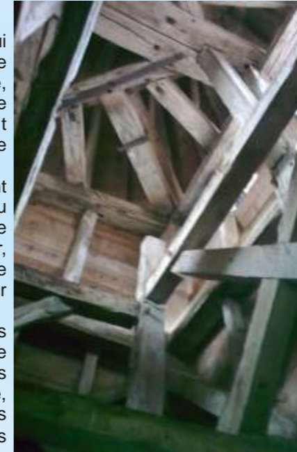
L'intérieur du clocher

De plus, divers mobiliers furent alors découverts : fragments de rebord de marmite (oule), fragments d'anses torsadées, plusieurs vases à rebord entiers, bouteille ovoïde, écuelles. Ces différents objets furent datés entre le XIII ème et le XVII ème siècle et des fragments de céramique beaucoup plus anciens dataient du V ème -VI ème siècle.