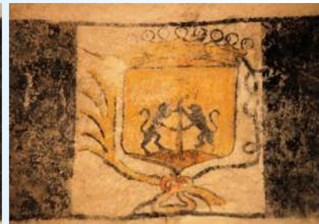
Deux blasons différents peints sur la litre funéraire. A qui appartenaient-ils ?