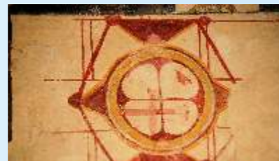
Plusieurs décors superposés