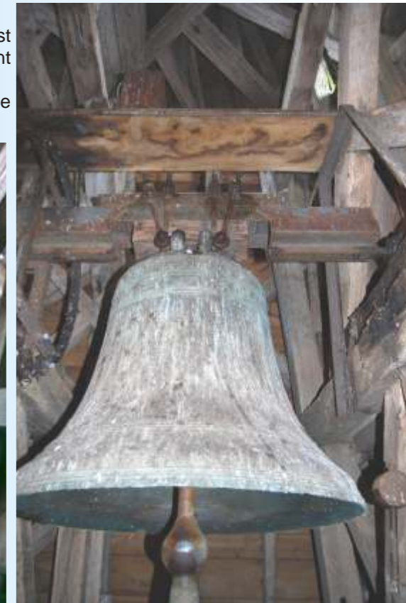
Fondue en 1584, date qui figure sur son corps, la cloche va être restaurée