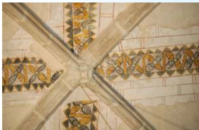
Frises décoratives sur la voûte de l'église