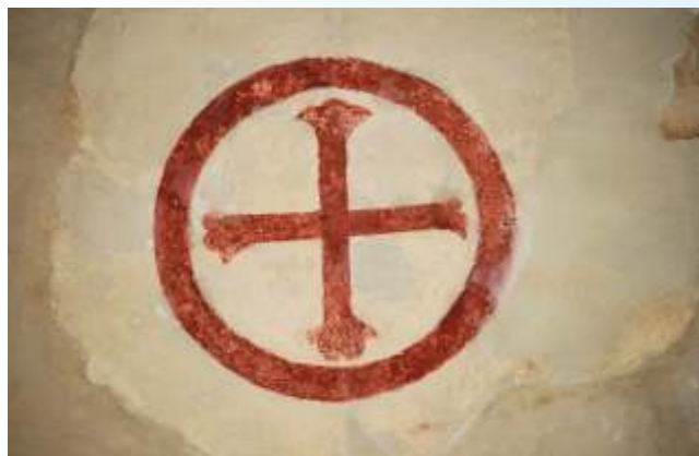
Une croix latine