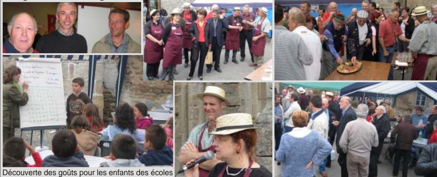
Découverte des goûts pour les enfants des écoles