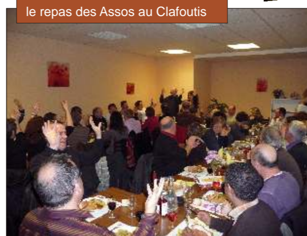
le repas des Assos au Clafoutis