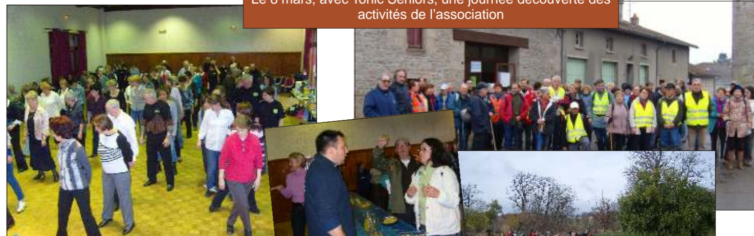
Le 8 mars, avec Tonic Seniors, une journée découverte des activités de l'association