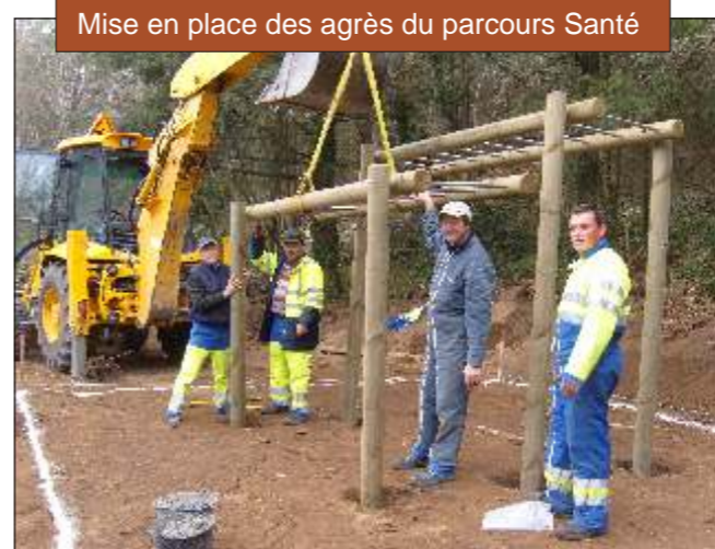
Mise en place des agrès du parcours Santé