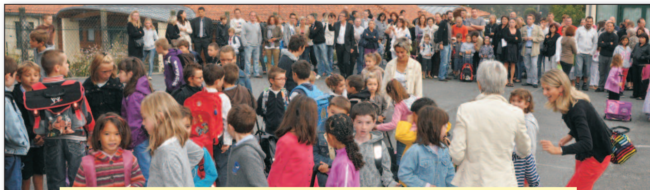
Saint-Gence, commune jeune ... Les 10 classes des deux écoles accueillent près de 240 enfants

Le prochain conseil municipal aura lieu le 28 juin 2013