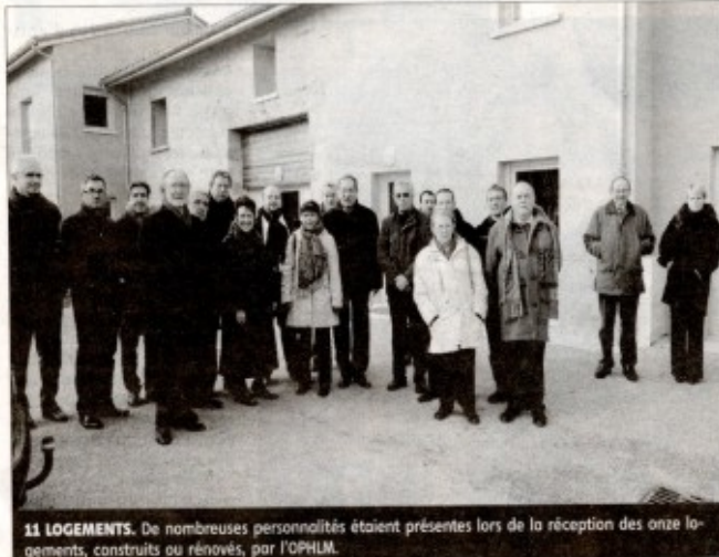
11 LOGEMENTS. De nombreuses personnalités étaient présentes lors de la réception des onze logements, construits ou rénovés, par l'OPHLM.

L'office public de l'habitat à loyer modéré (OPHLM) de Limoges-Métropole vient de réceptionner quatre logements et l'amélioration de sept autres.